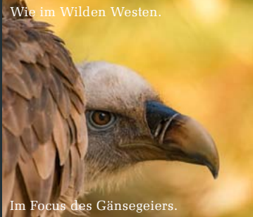
Im Focus des Gänsegeiers.