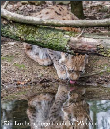
Ein Luchs spiegelt sich im Wasser.